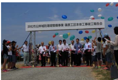
テープカット・風船飛ばし